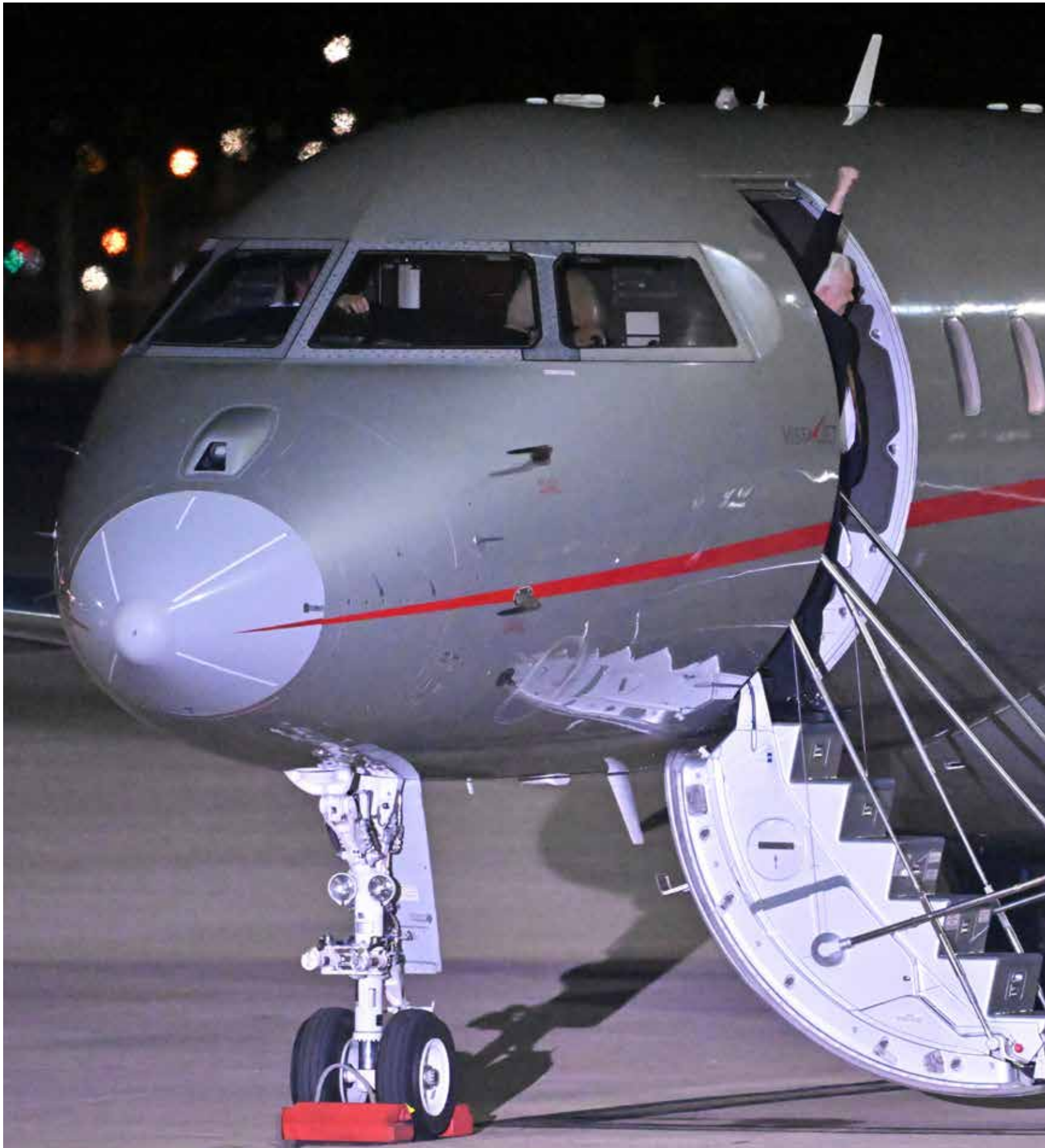
Mick Tsikas © ANP