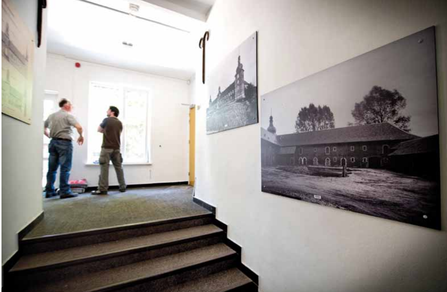
Expositieruimte in het projectbureau met foto's van hoe het slot er ooit uit zag.

Aryan Klein. Hij is in Engeland opgeleid tot jachtbouwer en in Lelystad opgeklommen naar de positie van hoofd bouw.