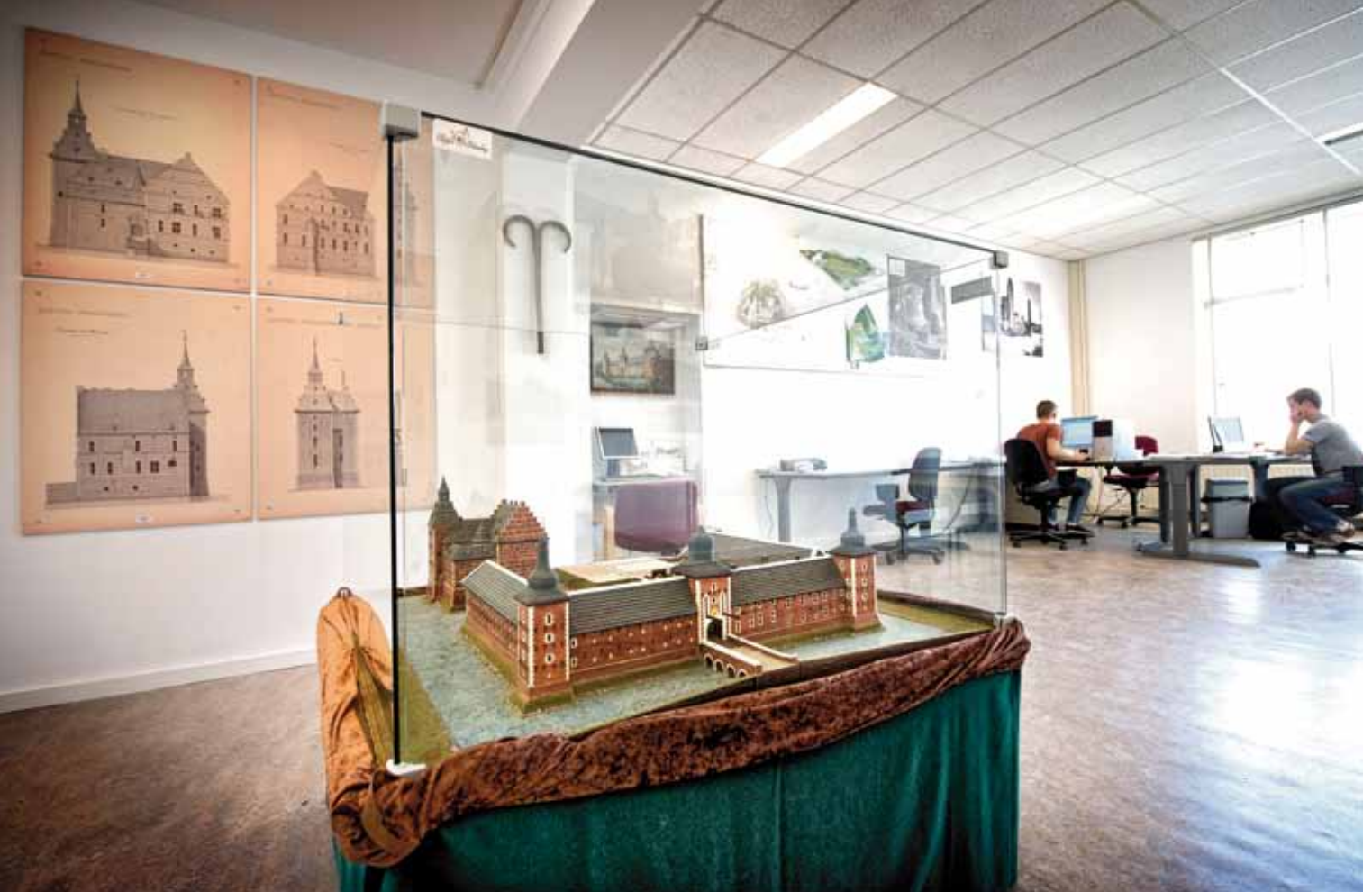
Maquette van slot en hoeve in het projectbureau.

leermeester-gezel wordt waar maar mogelijk toegepast. Daartoe zullen gepensioneerde of oudere werkloze vakmannen worden ingezet. Zij leiden er hun opvolgers, waaraan in Nederland nog een groot gebrek is, in de praktijk op.