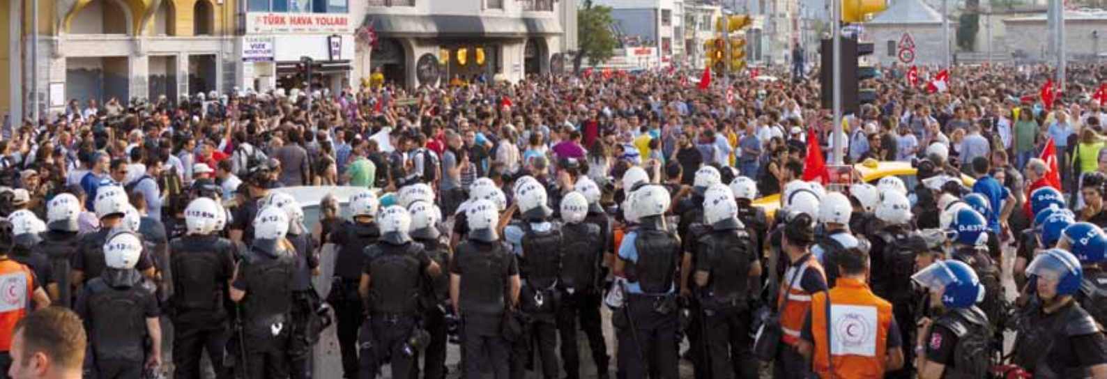
Eind juni 2013, politietroepen omsingelen het Taksimplein, de plek van de omstreden bouwplannen.