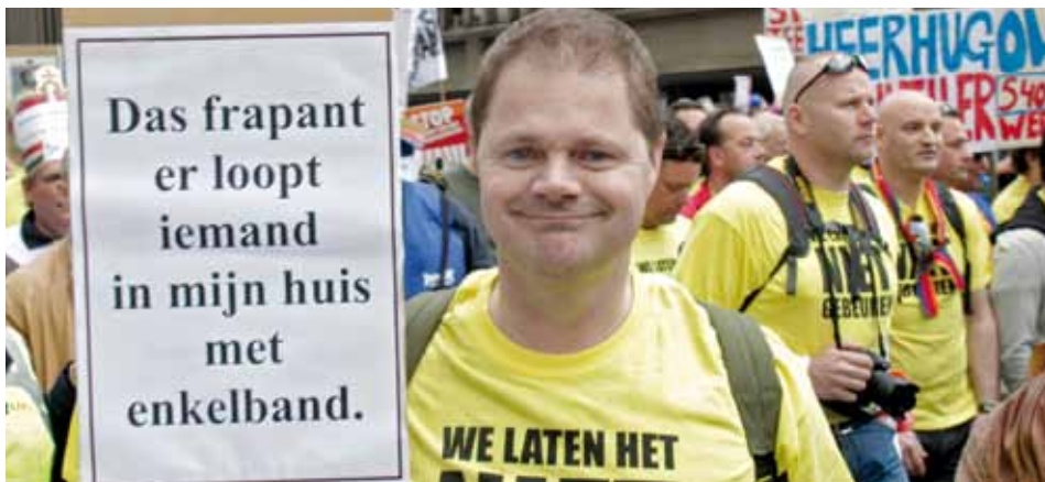
Meer dan 4.000 mensen uit het gevangeniswezen en de TBS-sector demonstreerden tegen het bezuinigingsplan van staatssecretaris Teeven.

SP-Tweede Kamerlid Nine Kooiman heeft tijdens het debat over het masterplan van staatssecretaris Teeven voor het gevangeniswezen het gevangenispersoneel gecompimenteerd. 'Dankzij hun acties en protest is het dramatische afbraakplan van tafel en is Teeven met een nieuw plan gekomen. Maar een afgezwakt slecht plan is nog steeds een slecht plan.' De sluiting van 23 inrichtingen en het vertrek van 2600 goed opgeleide medewerkers is volgens Kooiman onbegrijpelijke kapitaalvernietiging. 'Teeven heeft niet nagedacht over de veiligheid binnen en buiten de inrichtingen en financieel gezien rammelt het plan nog steeds aan alle kanten.'