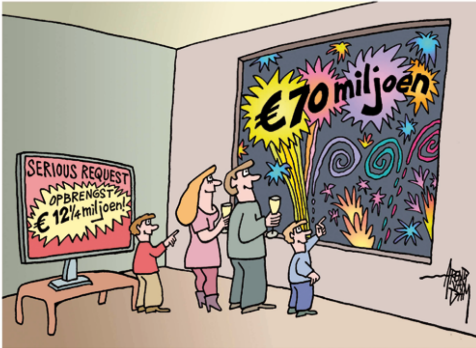
Nederland koopt voor € 70.000.000 aan vuurwerk