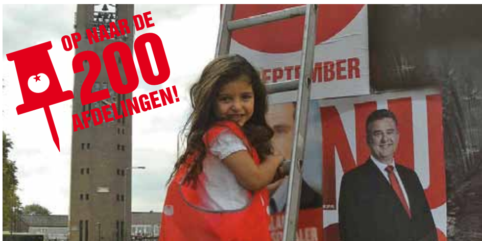
'Een rondje posters plakken is hier honderd kilometer'

Doordat de afdeling NOP zo goed op de hoogte is van wat er onder de mensen leeft, bruist de groep van de actie-ideeën. Van Sluijs: 'Onze leden zijn onze oren en handen. Tijdens onze maandelijks kerngroepbijeenkomst vragen we daarom altijd wat hun opgevallen is. Zo vertelde iemand bijvoorbeeld dat de voedselbank niet meer rond kon komen omdat de gemeente weigerde een subsidie van 6.000 euro te geven. De volgende dag stond een bezoek van raadsleden aan de