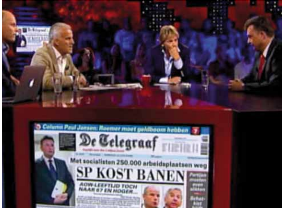
Emile Roemer tijdens de campagne bij De Wereld Draait Door.

‘Ja, dat klopt. Ik was campagneleider, samen met Tiny Kox. Tijdens de opnames heb ik me weleens zorgen gemaakt, je weet immers niet wat er met al die beelden gaat gebeuren. Ook als je moe bent of er even doorheen zit staat die camera voor je neus. Maar het viel me alles mee om ons zelf terug te zien. Emile voorop, het campagneteam eromheen. Het was geen campagne waar ik alleen maar slechte herinneringen aan overgehouden hebt. De campagne liet immers zien hoeveel mensen in ons land serieus overwogen hebben om op onze partij te stemmen. Nooit was de sympathie zo lang zo groot. Maar zeker de uitslag was alles behalve een