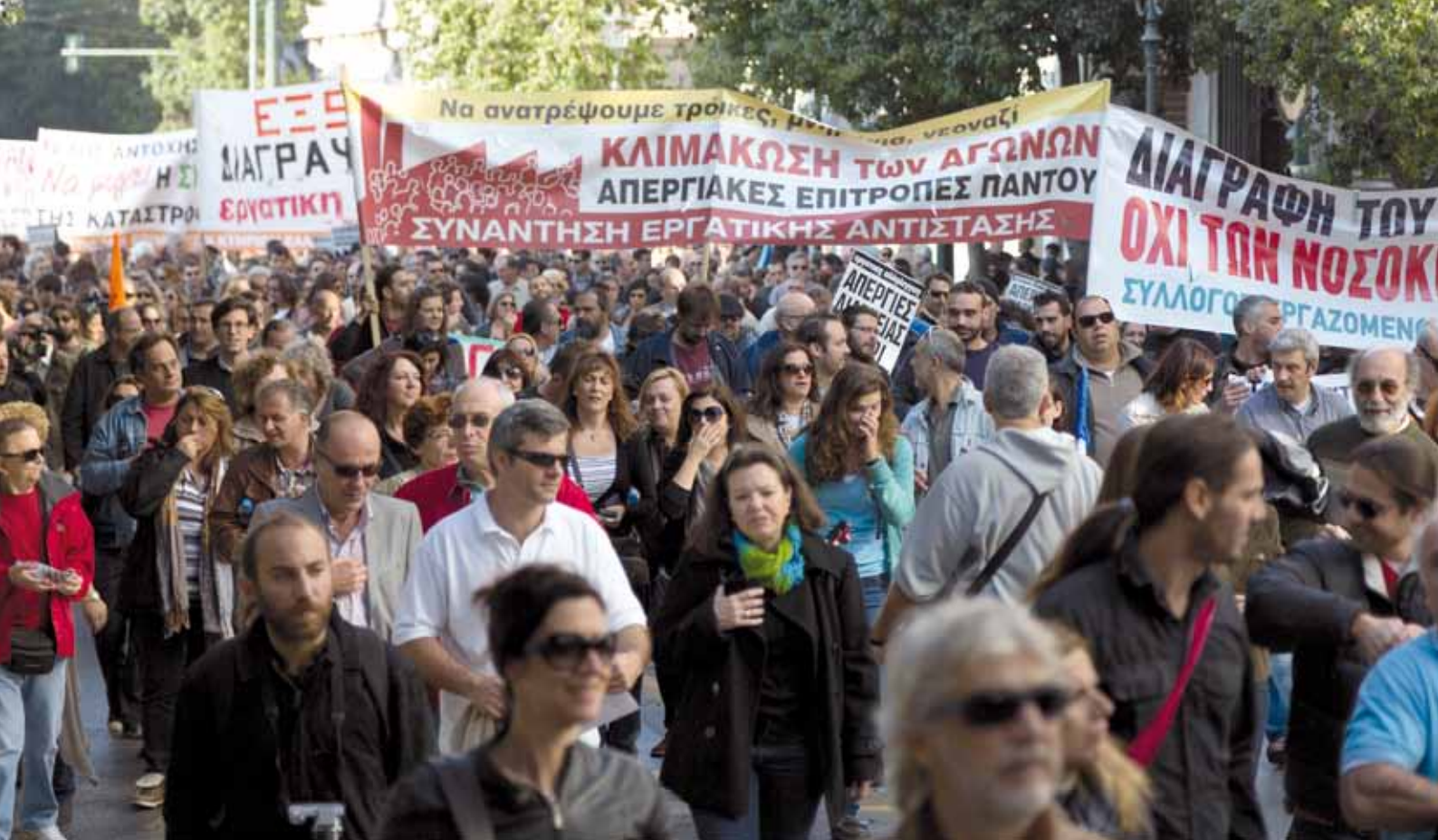
14 november 2012: Demonstraties en stakingen in Portugal en Griekenland (foto) tegen Europees beleid.