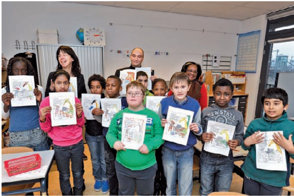
De eerste protest-kleurplaten zijn klaar.

Op 26 januari waren zo'n 20.000 leraren uit het voortgezet onderwijs in Utrecht bij elkaar om te protesteren tegen het onderwijsbeleid van minister Van Bijsterveldt. Op dezelfde dag startte SP-Tweede Kamerlid Jasper van Dijk in Amsterdam een kleurplatenactie met hetzelfde doel, maar dan voor leerlingen.