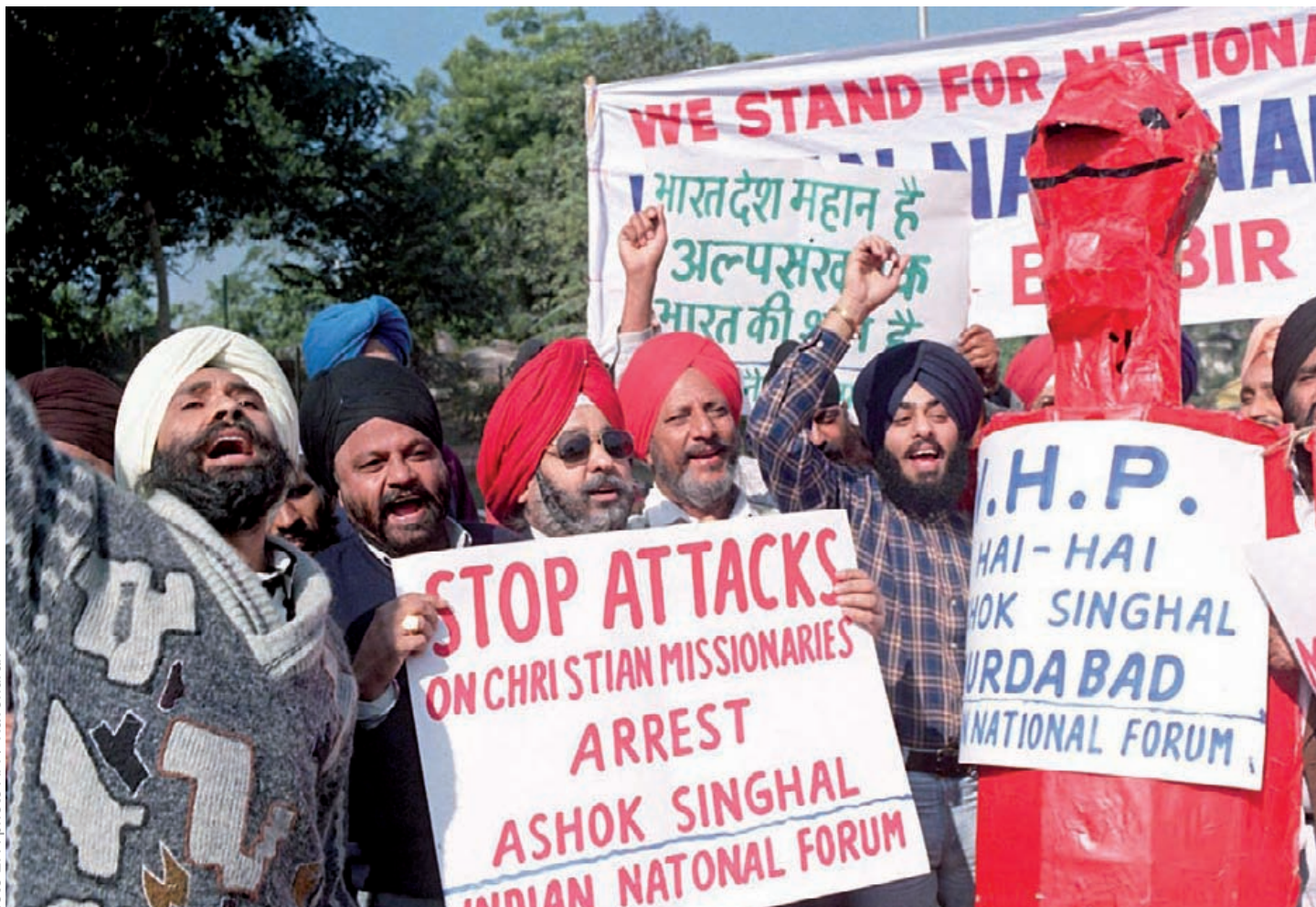
Protest tegen religieus geweld in New Delhi.