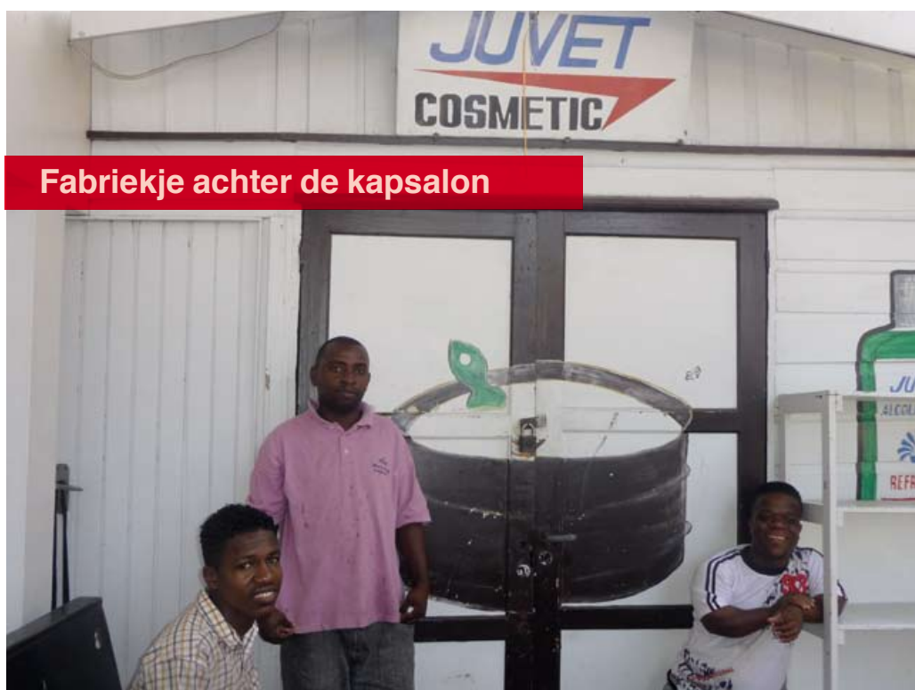
Fabriekje achter de kapsalon